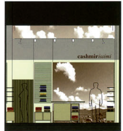
O: BLICK ZUR ANPROBE U: PRÄSENTATIONSKUBUS